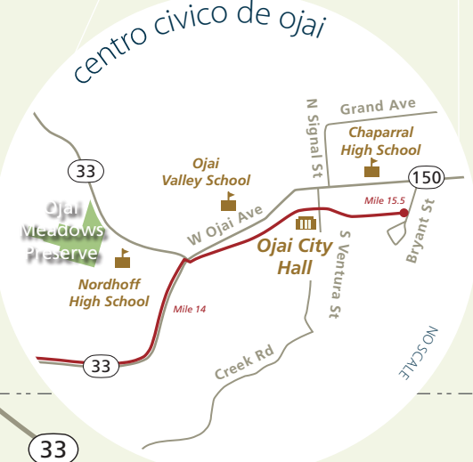
centro civico de ojai