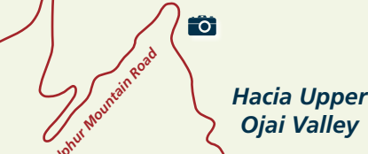
san antonio creek bridge